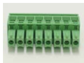
EC350R-08P 1個 I/O 用コネクタです。