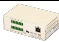
USBX-A0800 1台 製品本体です。

このたびは『USBX-A0800』をお買い上げ頂きありがとうございます。お手数ではございますが、最初に以下の部品が揃っているかをご確認の上、ご使用をお願い申し上げます。