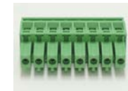
EC350RL-08P 1個 I/O 用コネクタです。